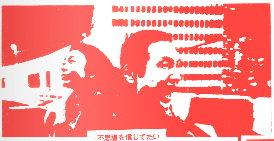
不思議を信じてたい