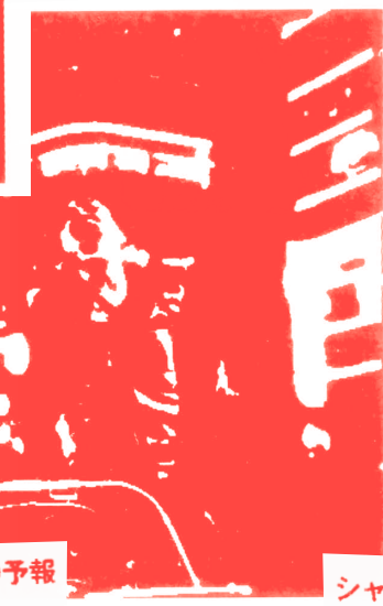
ここはいつまでも晴れの予報