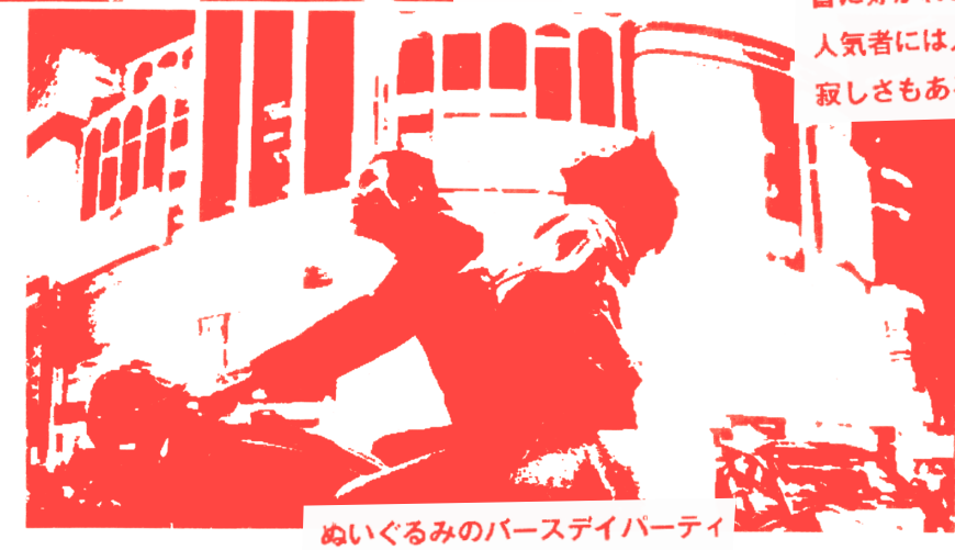
ぬいぐるみのバースデイパーティー