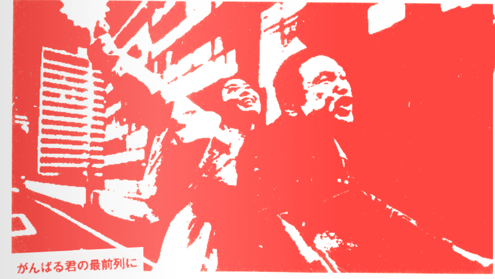
がんばる君の最前列に