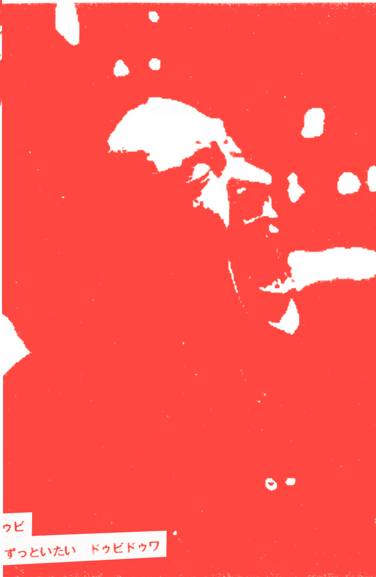
シュビドゥビ ドゥビドゥビ