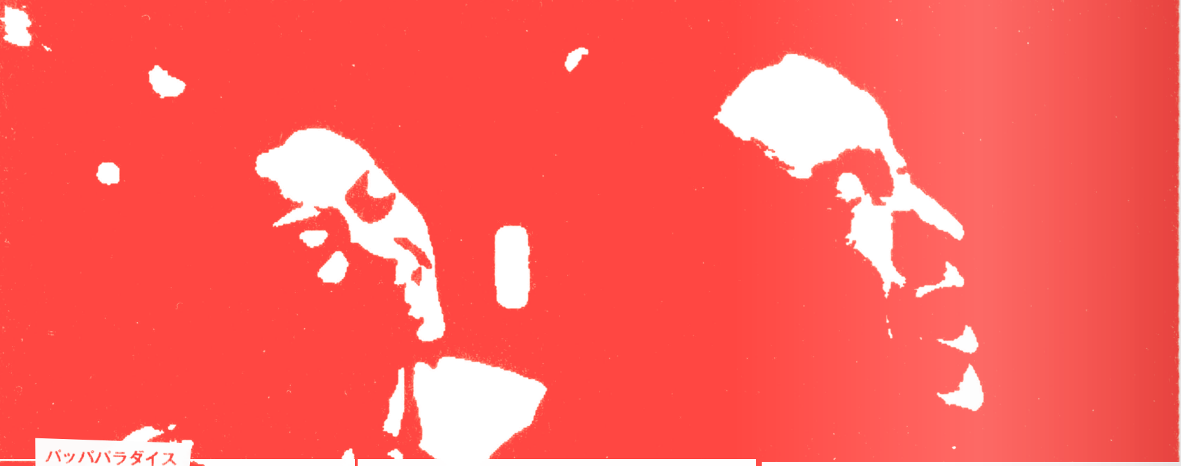
パッパパラダイス