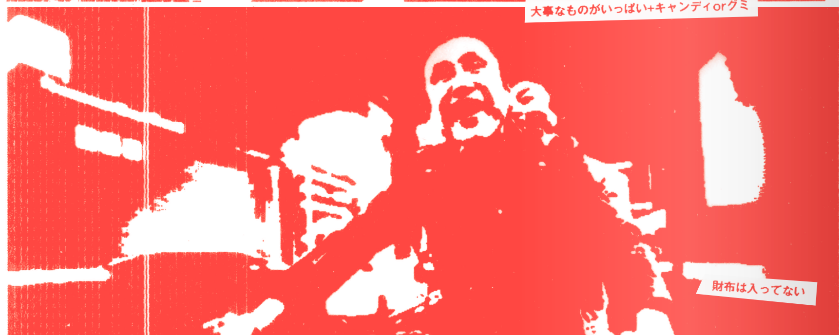
財布は入ってない