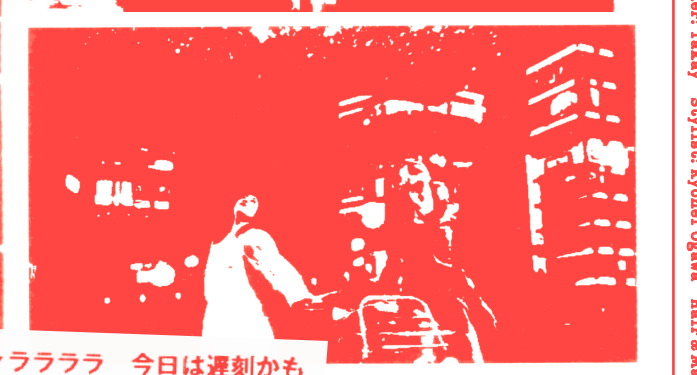
シャララララ 今日遅刻かも