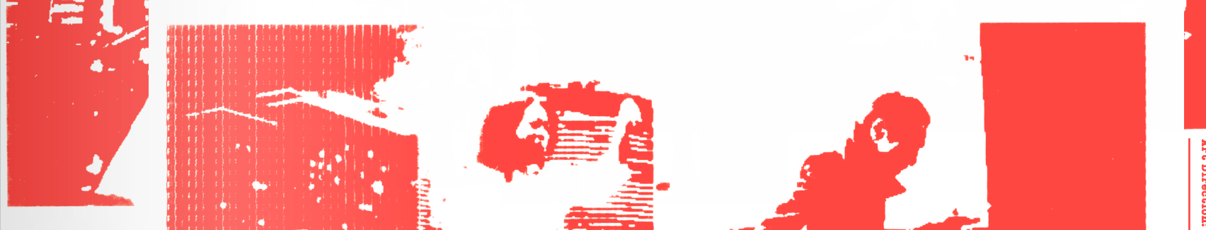
The sky is always blue When I'm thinking of you