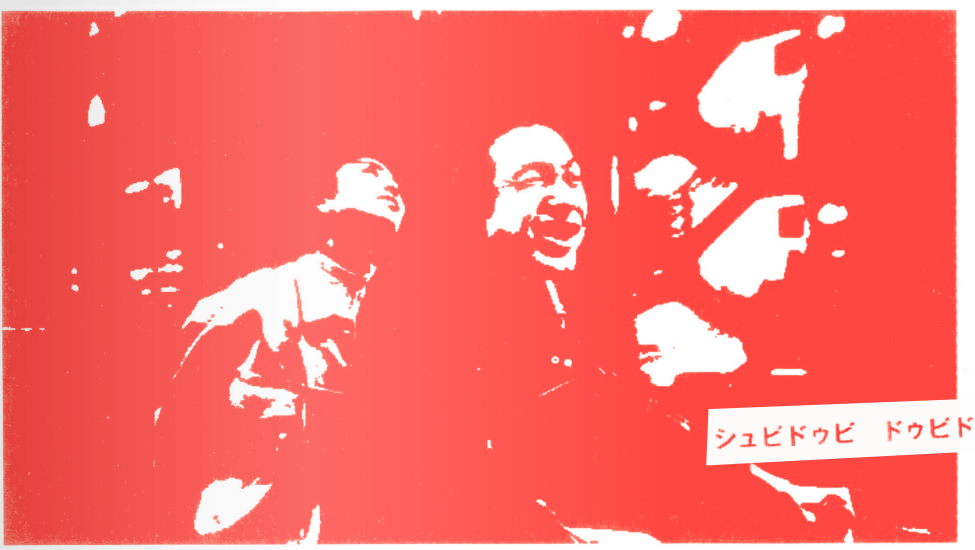
ずっといたい ドゥビドゥワ