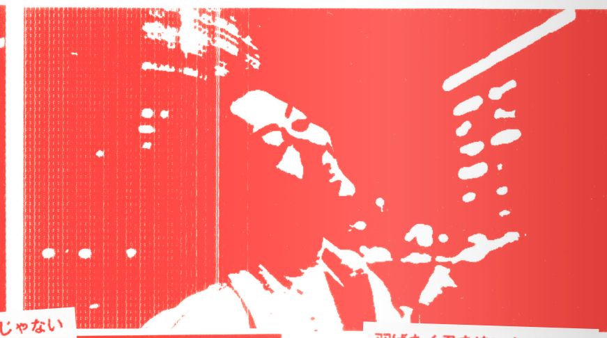
愚か者でいいじゃない