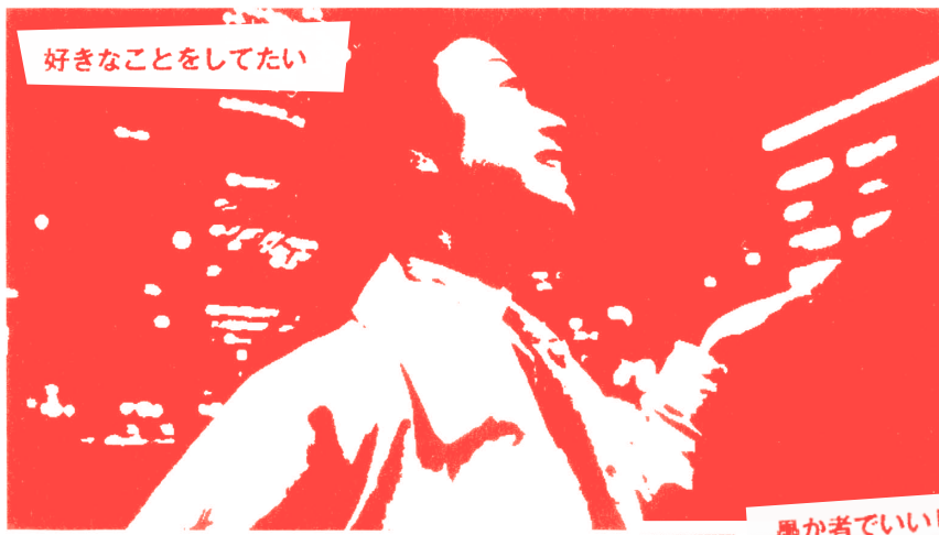
好きなことをしたい