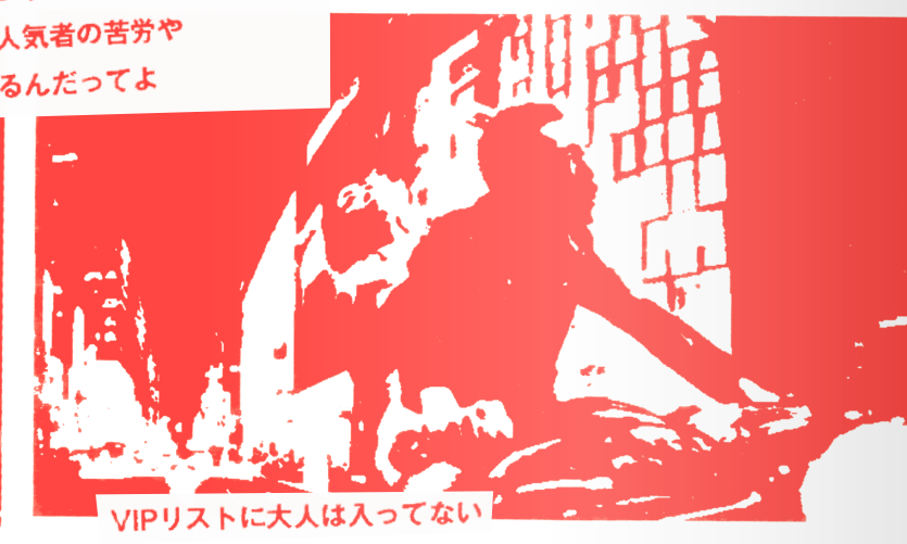
VIPリストに大人は入ってない