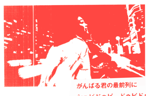
がんばる君の最前列に シュビドゥビ ドゥビドゥビ