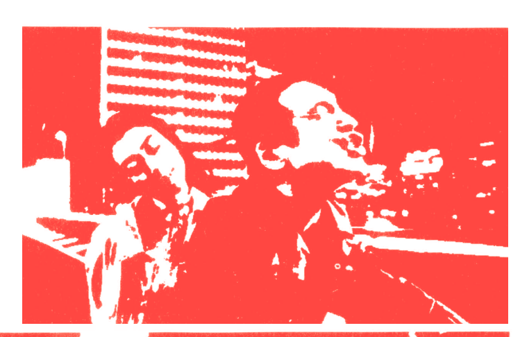
変わり者でいいじゃない