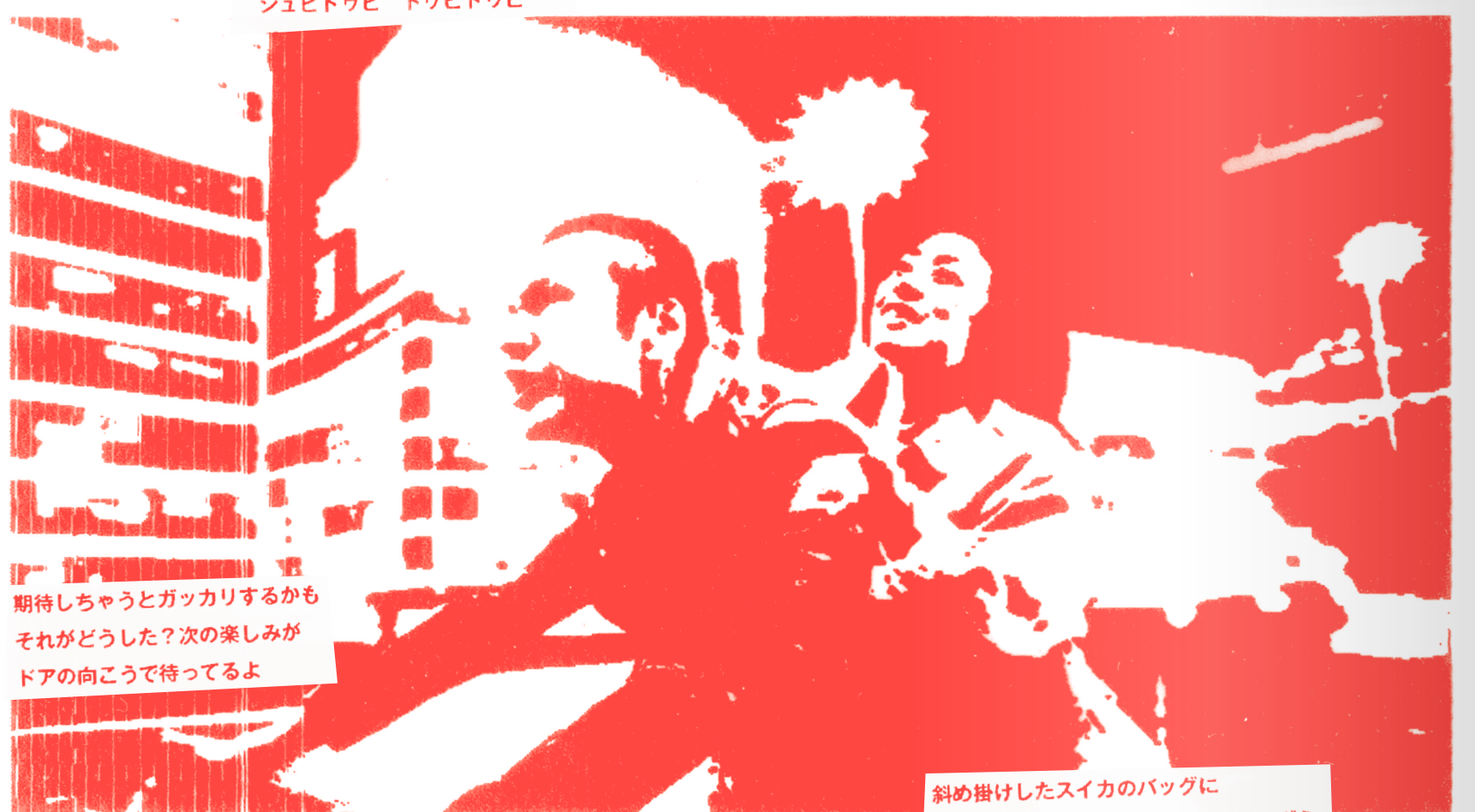
期待しちゃうとガッカリするかも それがどうした？次の楽しみが ドアの向こうで待ってるよ