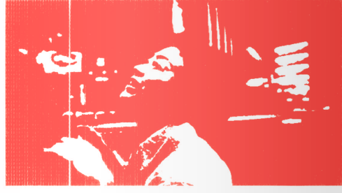
パッパパラダイス